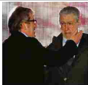
UMBERTO BOSSI IN LACRIME CON ROBERTO MARONI SUL PALCO DI BERGAMO