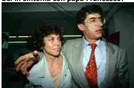
PIVETTI E BOSSI RESIZE

«Grande papa col dono della comunicazione che Ratzinger non aveva. Contrariamente alla fama, non è papa di rottura ma una variante efficace di Giovanni Paolo II. Mi piace molto».