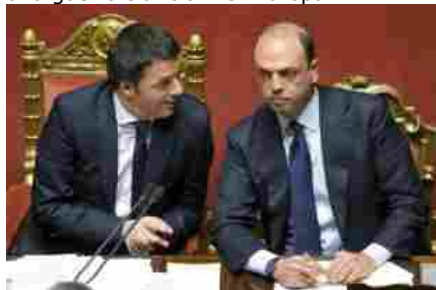
RENZI E ALFANO IN SENATO

«Sarebbe un atto criminale e scatenerebbe una guerra tra Islam e l'Europa».