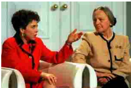
PIVETTI E JOTTI CC C F A D D BAF C D B

«Amo molto la tradizione cattolica. Ma ho imparato a dimostrarlo in modi meno chiassosi. Non più pubblicamente non essendo più personaggio pubblico».