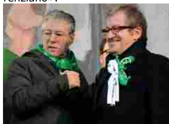
BOSSI E MARONI

«Assolutamente no. C'è una congiuntura internazionale meno sfavorevole e per scarroccio (termine marinaro: pigro abbrivio, ndr) ci muoviamo anche noi. Nessun merito renziano».